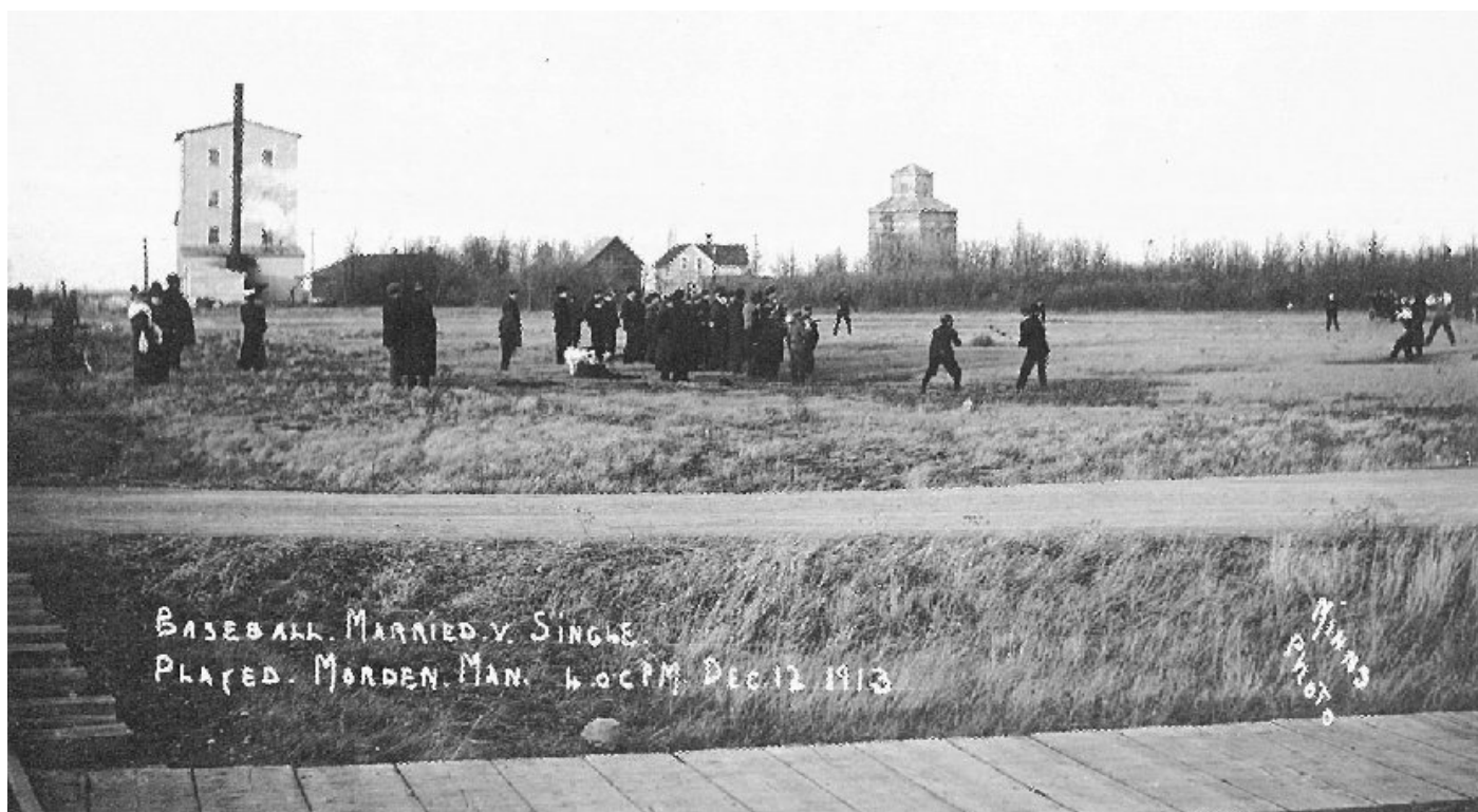
Бейсбольная игра, состоявшаяся в Мордене 12 декабря 1913 г. Женатые против холостых. Место: угол Третьей улицы и Стивен стрит