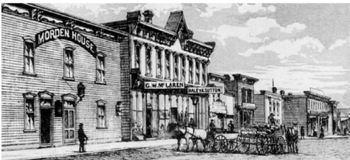
North Railway st.